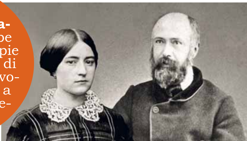
Louis e Zélie Martin, genitori di S ta Thérèse de Lisieux

Il pilotaggio è un percorso di iniziazione che dovrebbe consentire alle coppie di sapere, alla fine di questo periodo, se vogliono continuare a camminare o preferiscono rinunciare.